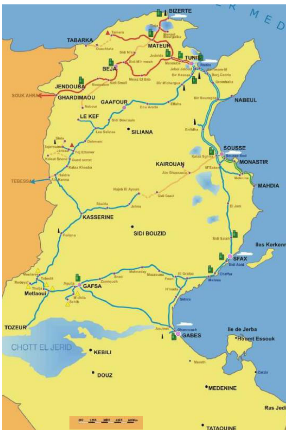
Schéma 2: Carte du réseau ferroviaire

La principale partie prenante publique est la SNCFT (Société nationale des chemins de fer tunisiens), l'opérateur ferroviaire tunisien. La SNCFT est une entreprise publique commerciale dont le réseau couvre 2 167 km. Le réseau de banlieue de Tunis couvre 23 km dont 17 km en triple voie entre Tunis et Hammam-Lif et 6 km en double voie entre Hammam-Lif et Borj Cedria . Quant au parc, 122 trains circulent quotidiennement dans la banlieue de Tunis, 46 dans les environs du Sahel, 58 sur les lignes principales. La SNCFT a été créée par décret le 27 décembre 1956. La partie nord du réseau (471 km) est en écartement standard (jauge internationale de 1 435 millimètres) tandis que la partie sud (1 688 km) est à écartement métrique (jauge de 1 000 millimètres) et principalement utilisé pour le fret. La carte ci-dessous illustre l'extension du réseau ferroviaire tunisien ainsi que ses composantes écartement standard et écartement métrique.